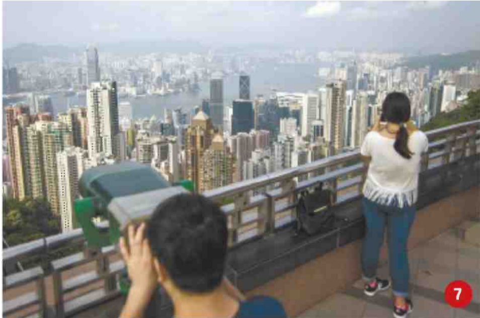
המשך מעמ' 1