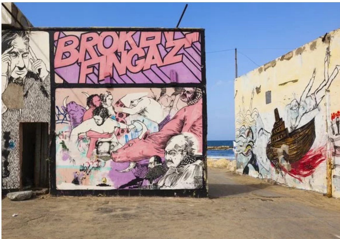
התיירים הצעירים מתעניינים בחוויות מקומיות כמו אמנות רחוב

מגמה מעניינת נוספת היא שהקהל שמגיע לארץ יותר צעיר, מה שמתכתב לדברי כתר עם מגמות באירופה. "באירון למעלה מארבעים אחוז מהתיירות היא של בני דור ה-Y, שנולדו בשנות ה-80 וה-90. דפוסי התיירות של הצעיר שונים: הם מעדיפים חופשות אורבניות (מה שמסביר את הפריחה התיירותית של תל אביב וירושלים), הם פחות מתעניינים בהיסטוריה פורמלית והרבה יותר בישראל העכשווית. הם מתעניינים בתרבות, אמנות, קולינריה, היינאוויז ומקומיות". מסיבה זאת, יש יותר ביקוש בשנים האחרונות לסיורים מיוחדים, סדנאות אוכל, סיורי אמנות רחוקים ועוד.