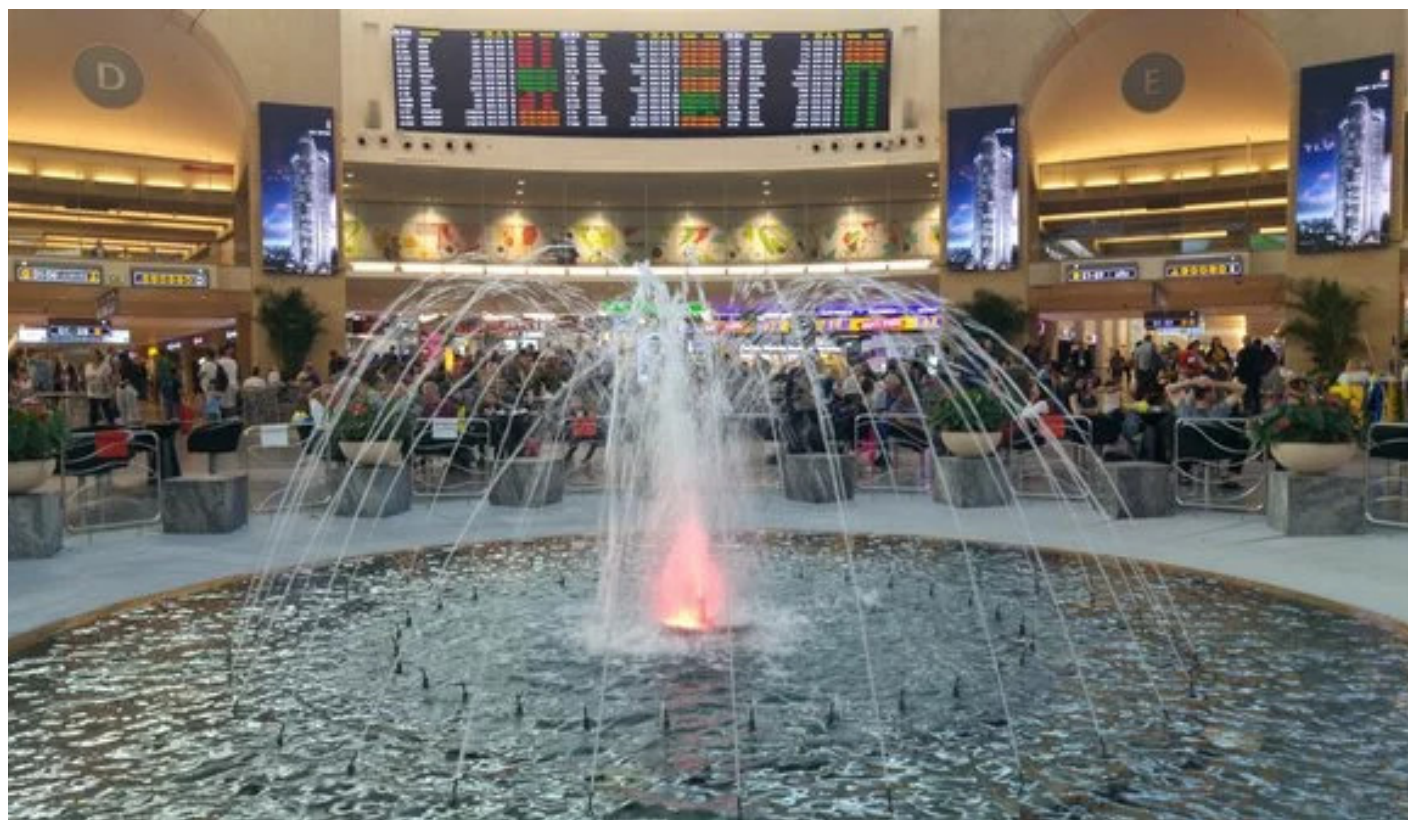
מספר התיירים שנחתים בבנת"ג עולה כל הזמן

אחוזים במספר המבקרים (בהמשך הכתבה תגלו למה). הפתעה נוספת היא העלייה במספר התיירים מסין ומקורי הדרומית. בשנה האחרונה. לא פחות מ-42 אלף תיירים מסין הגיעו לישראל, עלייה של שמונים אחוז ביחס לתקון המקבילה אשתקד, ו-24.5 אלף תיירים מקוריאה הדרומית (עלייה של 61 אחוז ביחס לתקופה המקבילה אשתקד).